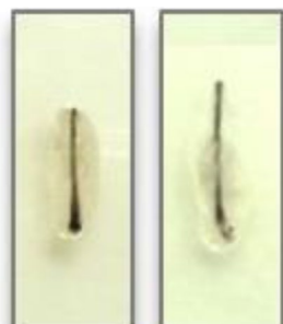
Day 0 Day 7